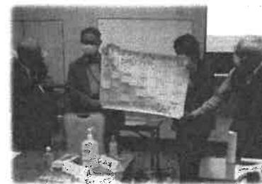
家庭教育支援関係者研修会