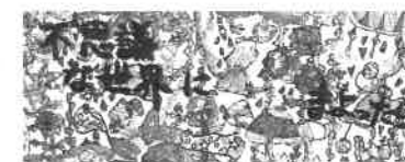
第9回 子ども読書本のしおりコンテスト最優秀作品