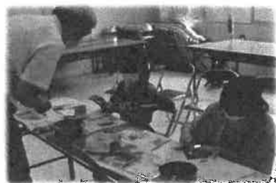
子ども体験教室（郷土資料館）